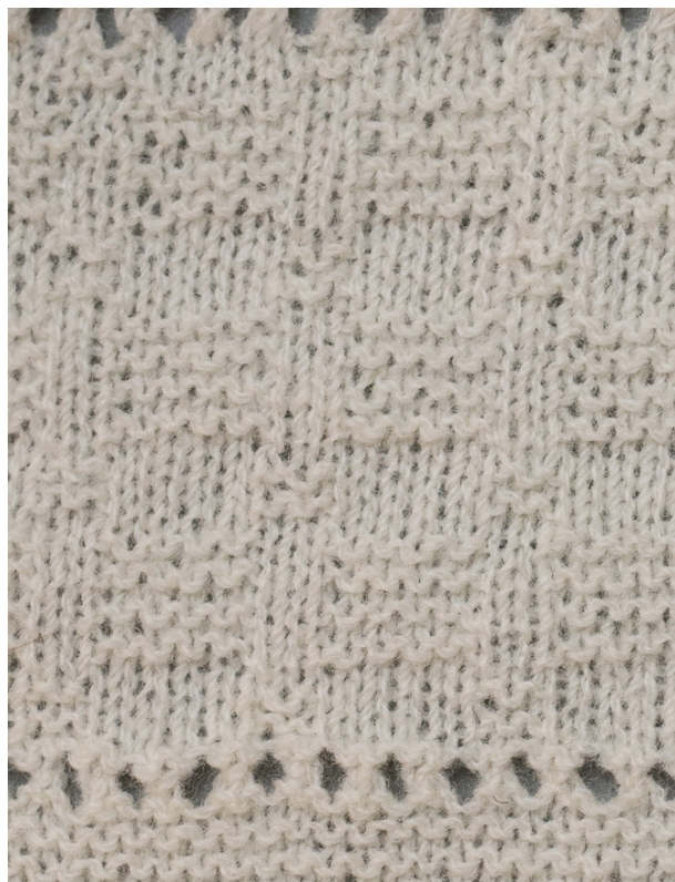
Strukturstrikk diagram G